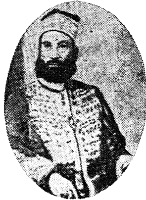
फसीट्टल मुल्क 'दारा'